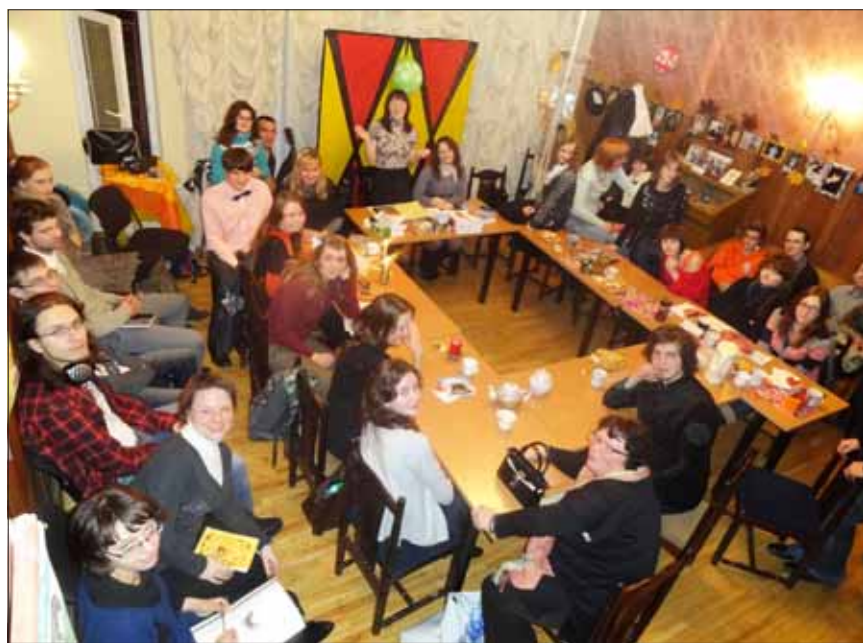
Современная библиотека - это пространство для общения

Студия слова и творчества «Жар-птица». На Гражданском проспекте, 83/1 ждут ребят с 7 лет, которые хотят на-