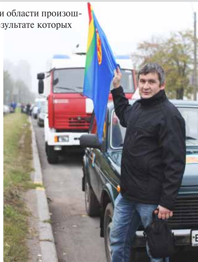
Представители 21 округа приняли участие в районном автопробеге «За безопасность на дорогах».

Пропаганда пока явно проигрывает в неравном бою с кровавой дорожной статистикой. Что еще мы можем противопоставить смертельному беспределу на трассах?