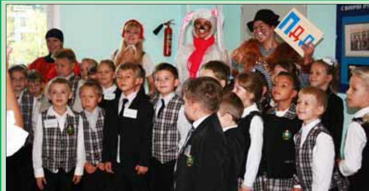
Для первоклассников нашего округа муниципалитет в самом начале сентября ежегодно организует театрализованные уроки дорожной азбуки. На этот раз маленькие школьники встречались с актерами Дома молодежи «Атлант», которые разыграли сказку «Красная шапочка в стране дорожных знаков».