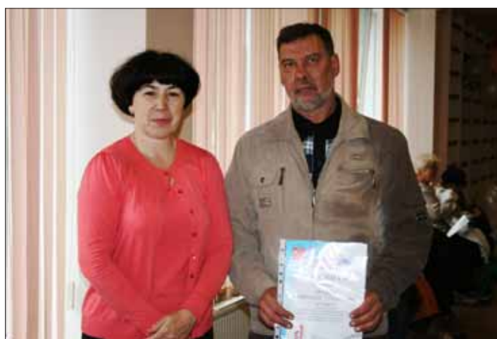
Глава МО МО №21 с победителем конкурса

Молодые актеры театрального коллектива «Комедианты» показали веселый спектакль «Ехала деревня мимо мужика», заставивший зрителей всех возрастов не раз улыбнуться. Гости, пришедшие на праздник, сами оказались участниками фольклорного действа, а самые бойкие ребята сумели продемонстрировать свою смекалку и ловкость прямо на сцене. Конечно, не обошлось без призов и сувениров. Но самые главные награды получили уважаемые жители нашего округа - лидеры народного озеленения.