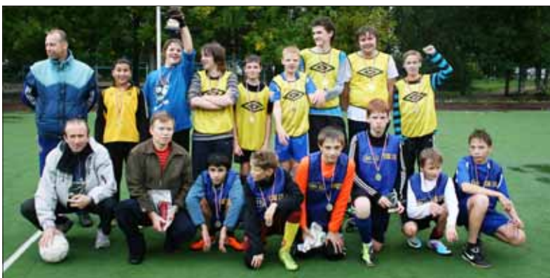
На поле соперники, в жизни - друзья: команды 72 и 175 школ, взявшие «золото» и «серебро».