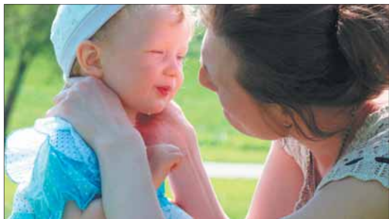
Мамочка и Любочка. Автор - Анастасия Мельникова.

Дорогие жители округа! Приглашаем вас принять участие в конкурсе «Мама лучшая моя». Принимаются сочинения в прозе и стихах, а также рисунки и фотографии, посвященные мамам, семьям, домашнему очагу.