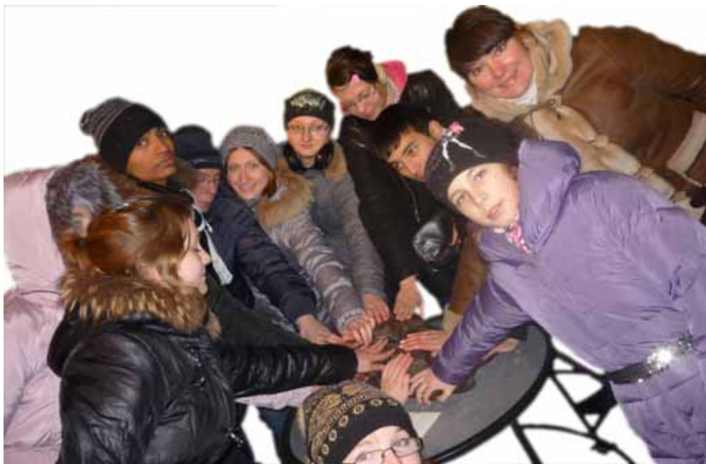
В Музее космонавтики нужно прикоснуться к метеориту - на счастье. Петербург, Петропавловская крепость.

Р азрешите поздравить замечательного, отзывчивого человека Валентину Костину с весенним праздником 8 марта!