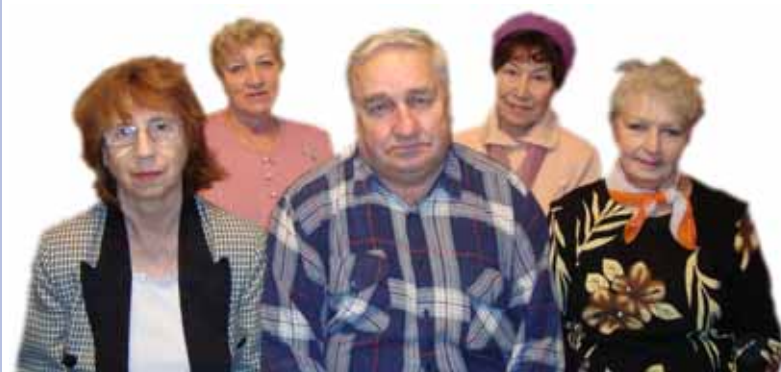
Группа жителей округа проходит обучение правилам безопасности.

Е жегодно 1 марта в мире отмечается Всемирный день гражданской обороны. Знания, как грамотно вести себя в чрезвычайной ситуации, нужны каждому.