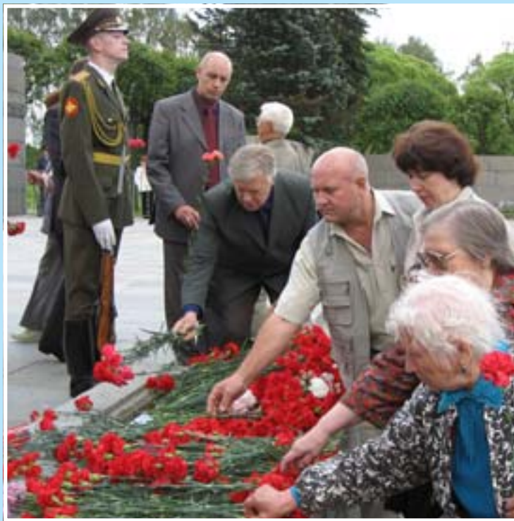
Возложение цветов 22 июня