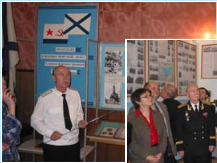
Открытие "Комнаты воинской славы 3-й дивизии атомных подводных лодок Северного флота". Музейная экспозиция созданная Муниципальным Советом МО № 21, совместно с Отделом по работе с юношеством Центральной городской публичной библиотеки по адресу: Гражданский проспект 121/100.