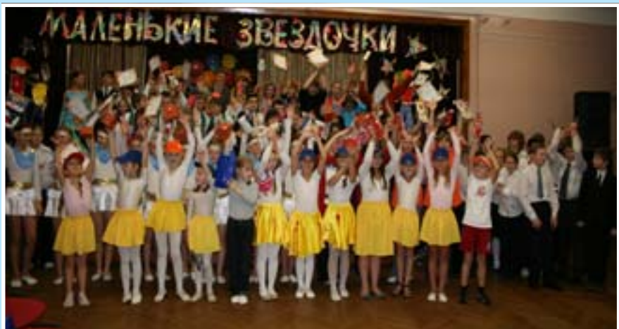
Смотр художественной самодеятельности