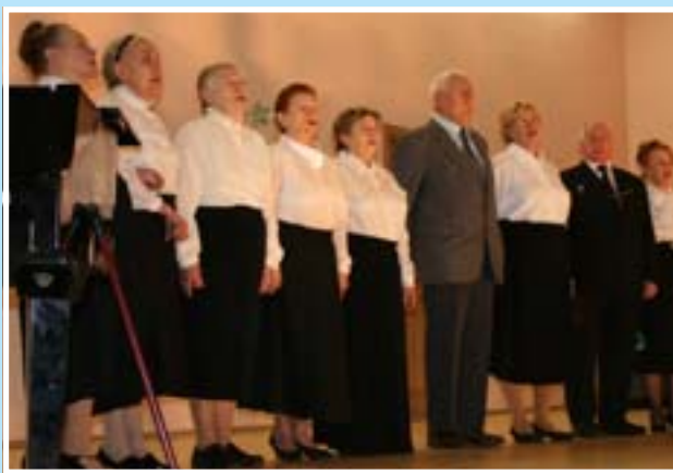
Выступление народного хора округа в День пожилого человека