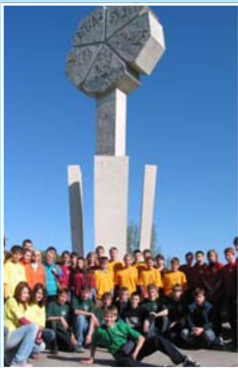
Турслет Дорога жизни