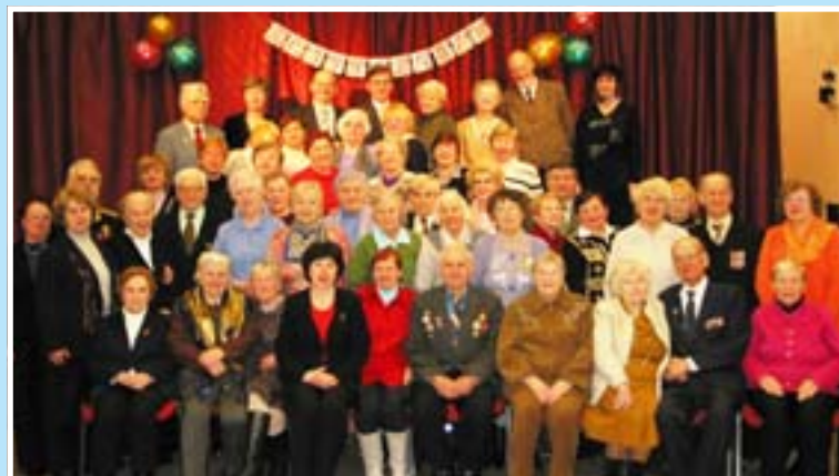
В 2007 году исполнилось 20 лет ветераскому движению МО 21 округ