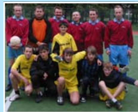
Турнир по футболу. Преподаватели физкультуры и победители турнира.

В 1998 году в Петербурге появилось местное самоуправление, на тот момент передовой для России опыт. Отметив юбилей нашего Муниципального Совета МО 21, можно подвести итоги и заглянуть в завтрашний день.