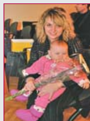
Оператор целевой программы