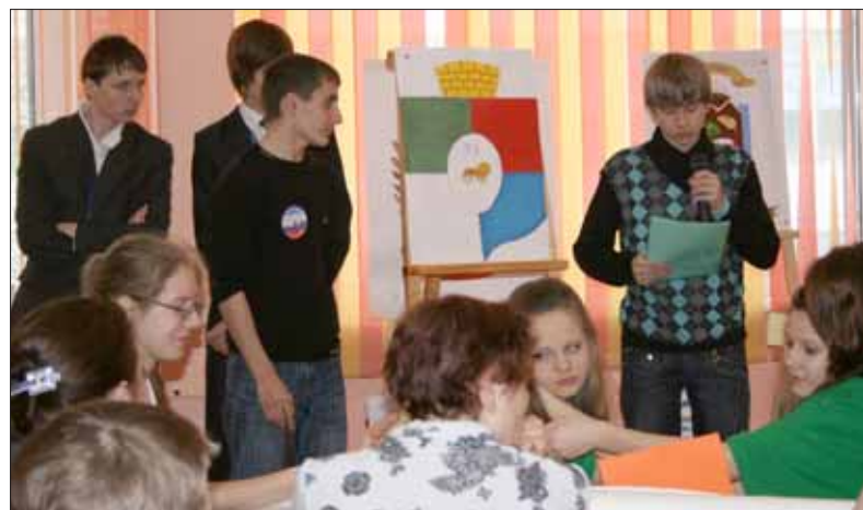
Нужно было не только придумать герб Калининского района, но и защитить свой проект.