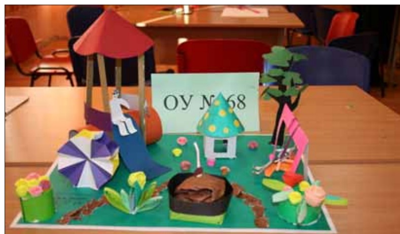
Какой должна быть дворовая площадка, ребята показали с помощью цветной бумаги.