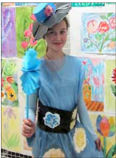
Чтобы выглядеть эффектно, можно обойтись и без дорогих материалов.

На занятиях в Центре эстетического воспитания Калининского района педагоги и воспитанники часто