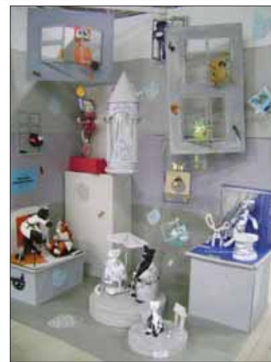
На Всероссийском конкурсе «Комната моей мечты» в этом году царил мир сказки.

Поздравляем всех участников и победителей конкурса! Благодарим