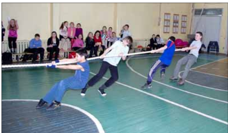
Болельщики «Веселых стартов» захотели стать их непременными участниками!