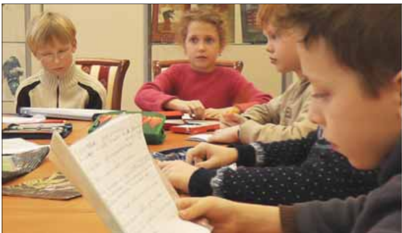
Занятия в литературной студии «Жар-птица» проходят в филиале библиотеки им. В.В. Маяковского на Гражданском, 121.

Во время полёта звёзды вокруг были как хлопья «Космостарс», а чёрная дыра — растёкшийся шоколад. Я подлетел к Земле, то есть тарелке супа. Облака — сахарная