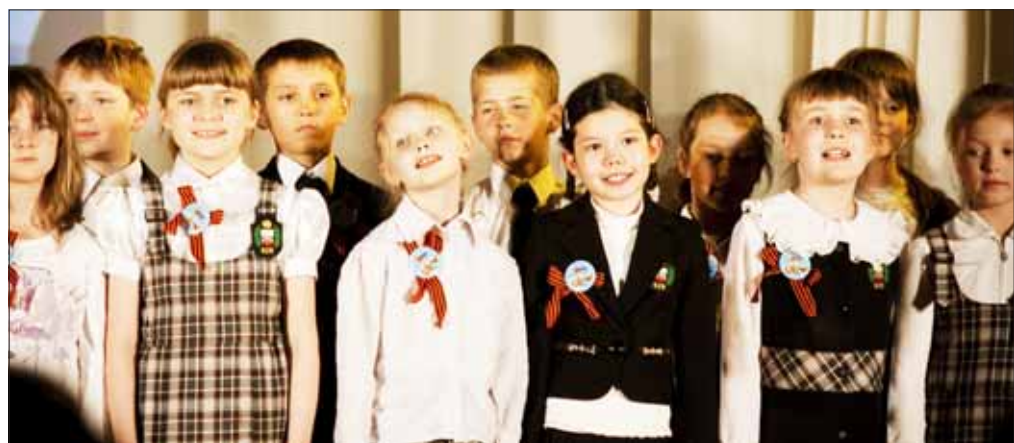
Учащиеся 619 школы подготовили для ветеранов концерт