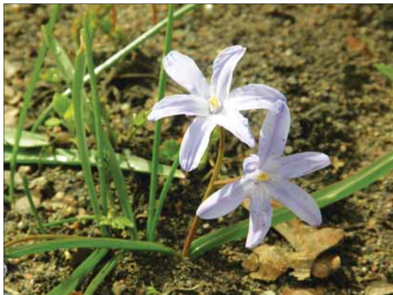
Во дворе на Гражданском, 117 уже распустились первоцветы

- Совсем недавно на субботники выходило по 40 человек, нам казалось, еще чуть-чуть - и будет вокруг только красота. Но собак на клумбах, окурков в цветниках, мамочек с банками пива на лавочках не становится меньше. В ответ на