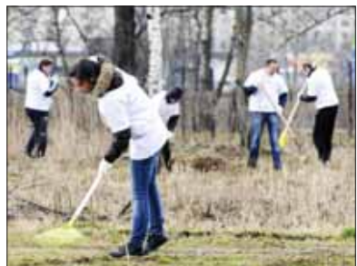
В пойме Муриноского ручья работали добровольцы из НКП «Региональное «Объединение».