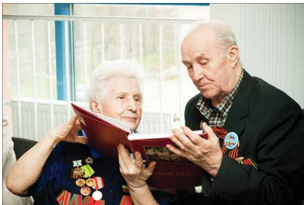
Ветераны получили авторские экземпляры книги «Живая память»

Некоторые истории из книги «Живая память» вы можете прочитать на стр. 4-5 нашей газеты.