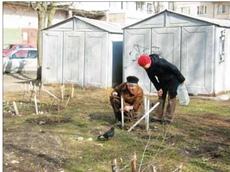
Жительницы дома 117/1 по Гражданскому проспекту разбили клумбы на затоптанном участке двора. Надеемся, их усилия заметят и поддержат не только члены конкурсной комиссии, но и соседи по дому.

Участником смотра-конкурса-2010 может стать любой житель округа. Для участия в конкурсе необходимо подать письменную заявку в местную администрацию (ул. Лужская, 10). В заявке укажите фамилию, имя, отчество участника, адрес и кон-