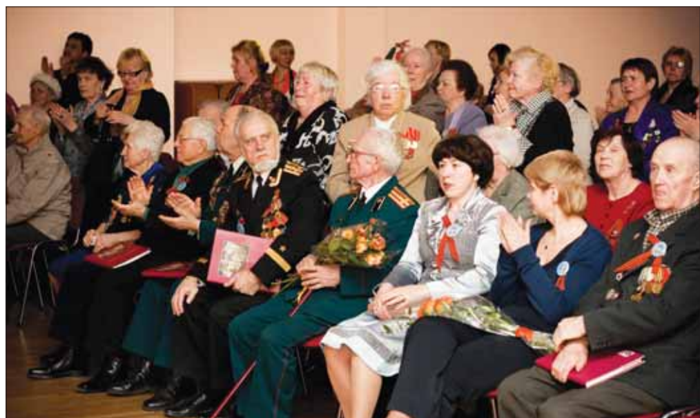
В зале собрались авторы и члены редколлегии книги воспоминаний о войне и Победе